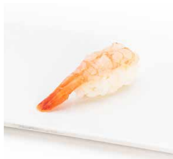
038 NIGIRI EMAEBI 1PZ (bocconcini di riso con gambero rosso) € 2.00