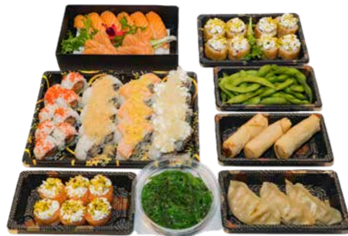
BOX 64 PZ 32 Uramaki, 8 uramaki fritti, 6 nigiri, 6 gunkan, 6 sashimi + 4 antipasti € 50.00