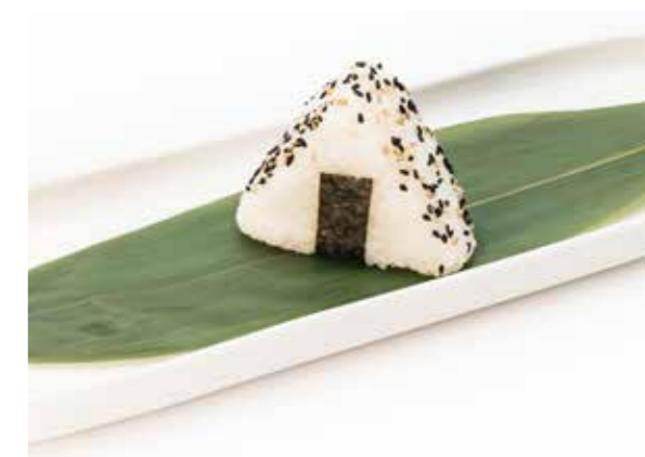
083 ONIGIRI MAGURO 1PZ (tonno cotto, mayo, sesamo, teriyaki) € 3,00