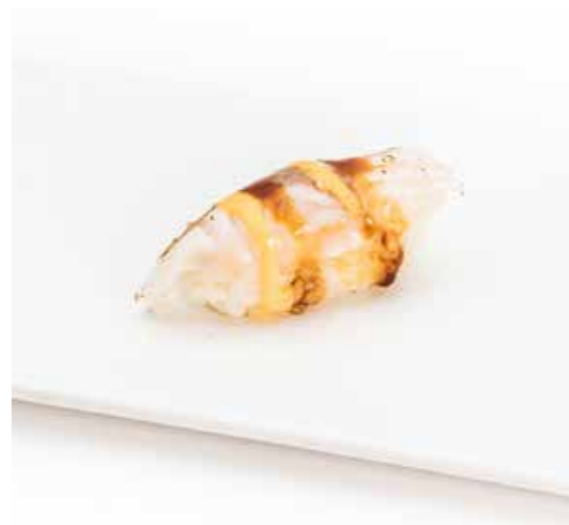
036 NIGIRI FLAMBE SUZUKI 1PZ (bocconcini di riso con spigola scottata con fegato d'oca e teriyaki) € 2.00