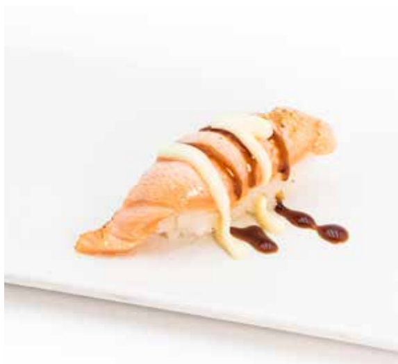
032 NIGIRI FLAMBE SAKE 1PZ (bocconcini di riso con salmone scotatto con maionese e teriyaki) € 2.00