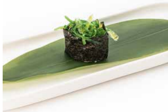
071 NORI WAKAME 1PZ (bocconcini di riso avvolti con alghe, wakame) € 2,00