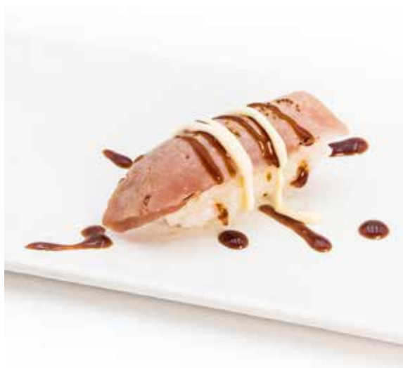
034 NIGIRI FLAMBE TUNA 1PZ (bocconcini di riso con tonno scotatto con maionese e teriyaki) € 2.00