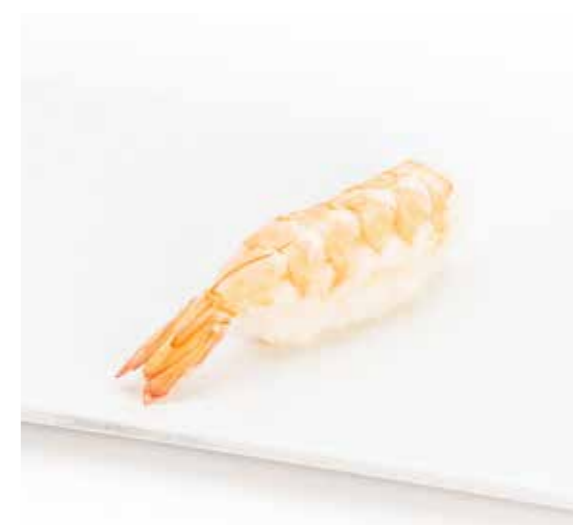
037 NIGIRI EBI 1PZ (bocconcini di riso con gambero cotto) € 1.50