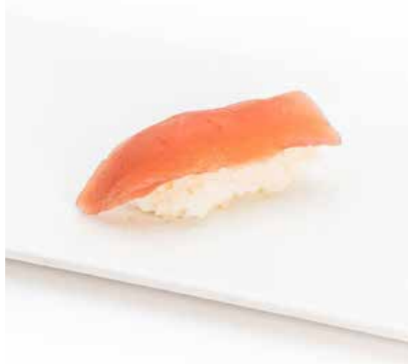
033 NIGIRI MAGURO 1PZ (bocconcini di riso con tonno) € 1.50