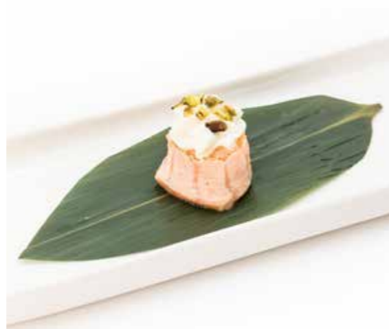
070 GUNKAN FLAMBE FLOWER PZ1 (bocconcini di riso avvolti con salmone scottato, philadelphia, pistacchio) € 2,50