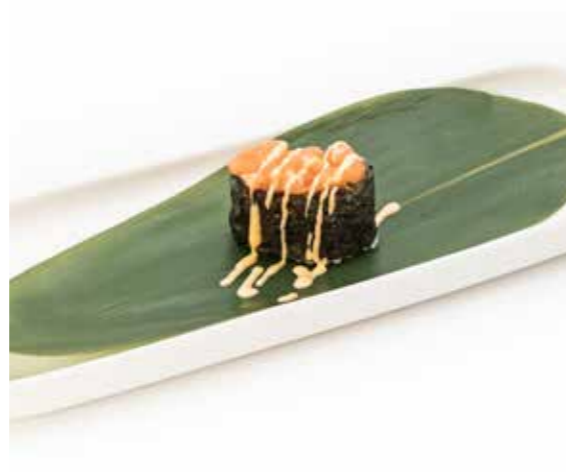
072 NORI SAKE SPICY 1PZ (bocconcini di riso avvolti con alghe, guarniti con tartare di salmone piccante) € 2,00