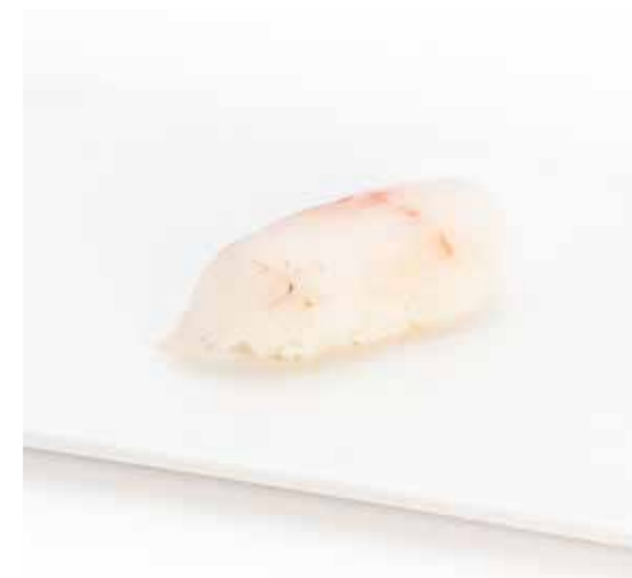
035 NIGIRI SUZUKI 1PZ (bocconcini di riso con spigola) € 1.50