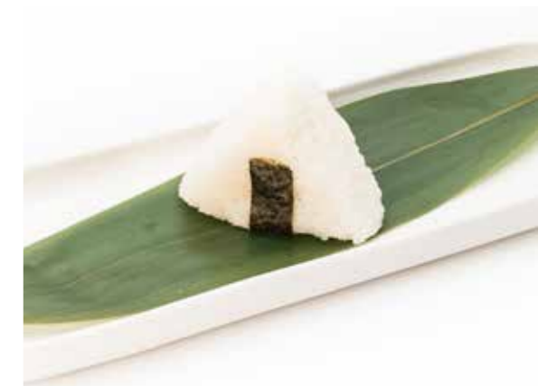
085 ONIGIRI ANGUILLA 1PZ (anguilla, mayo e teriyaki) € 3,00