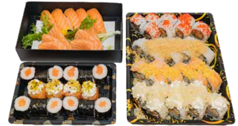
BOX 58 PZ 32 Uramaki, 5 nigiri, 6 sashimi, 4 gunkan, 12 hosomaki € 35.00