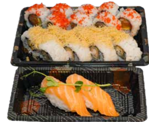
MINI BOX 18 PZ 16 Uramaki, 2 nigiri € 16.00