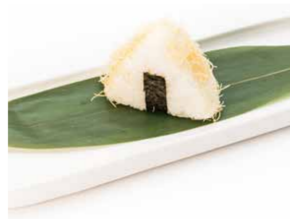
084 ONIGIRI TEMPURA 1PZ (gamberi fritti, mayo e teriyaki) € 3,00