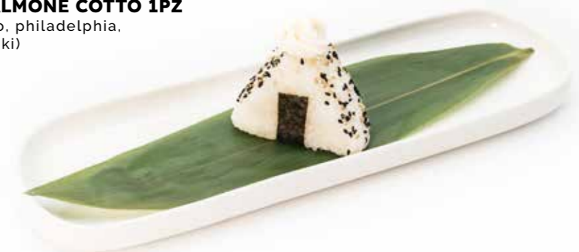
081 ONIGIRI SALMONE COTTO 1PZ (salmone cotto, philadelphia, sesamo, teriyaki) € 3,00