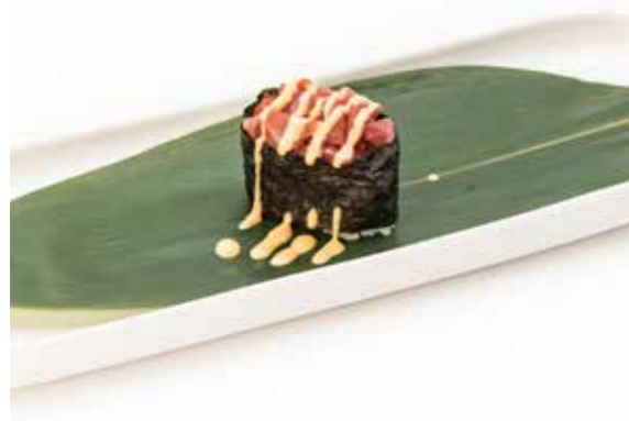
073 NORI TUNA SPICY 1PZ (bocconcini di riso avvolti con alghe, guarniti con tartare di tonno piccante) € 2,00