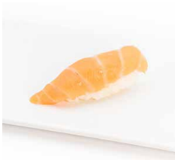
031 NIGIRI SAKE 1PZ (bocconcini di riso con salmone) € 1.50