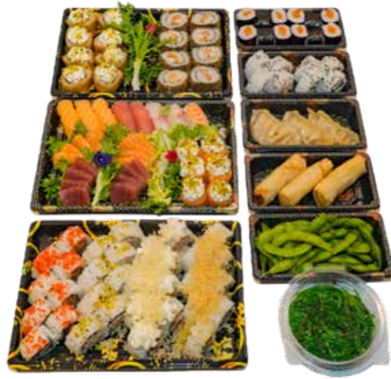
BOX 98 PZ 40 Uramaki, 16 uramaki fritti, 8 nigiri, 6 gunkan, 16 sashimi + 4 antipasti € 80.00