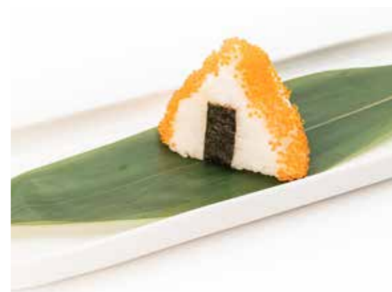
082 ONIGIRI SALMONE CRUDO 1PZ (salmone crudo, tobiko, teriyaki) € 3,00