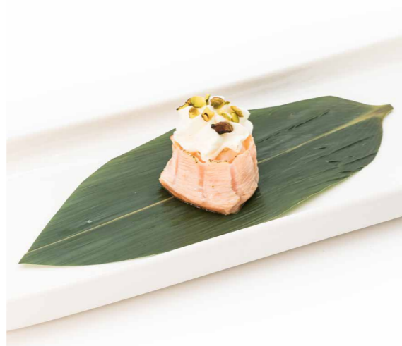
070 GUNKAN FLAMBE FLOWER PZ1 (bocconcini di riso avvolti con salmone scottato, philadelphia, pistacchio) € 2,50