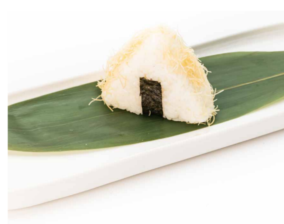
084 ONIGIRI TEMPURA 1PZ (gamberi fritti, mayo e teriyaki) € 3,00