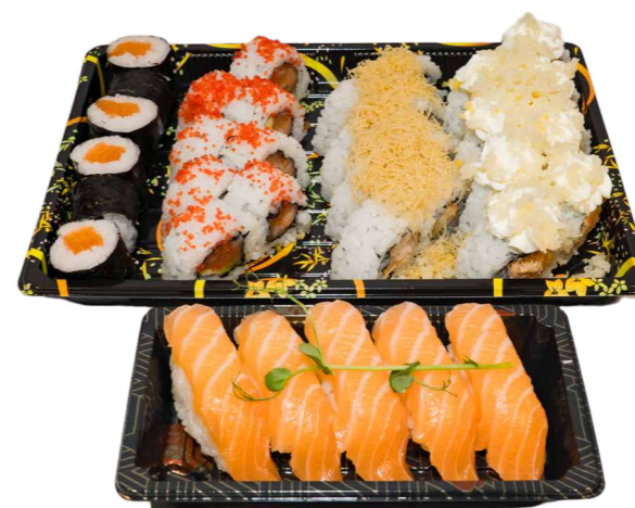
BOX 35 PZ 24 Uramaki, 6 hosomaki, 5 nigiri € 25.00