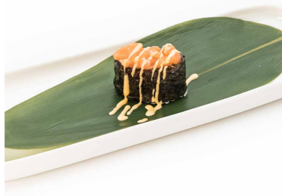
072 NORI SAKE SPICY 1PZ (bocconcini di riso avvolti con alghe, guarniti con tartare di salmone piccante) € 2,00