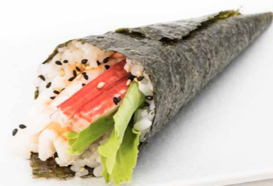
TEMAKI SAPE SPICY 1PZ (cono di alga nori con riso, salmone, avocado e sesamo, salsa maionese piccante) € 4.00