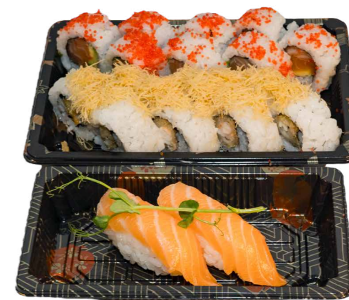
MINI BOX 18 PZ 16 Uramaki, 2 nigiri € 16.00