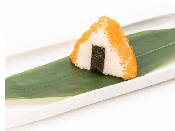
082 ONIGIRI SALMONE CRUDO 1PZ (salmone crudo, tobiko, teriyaki) € 3,00