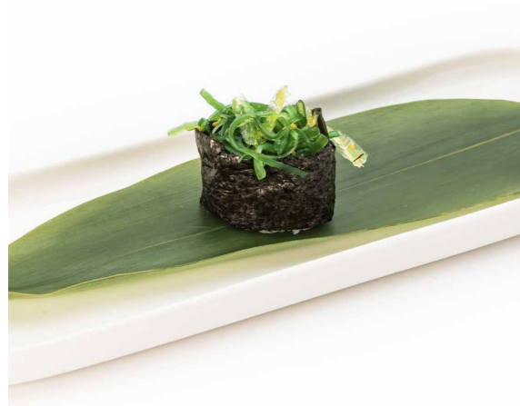
071 NORI WAKAME 1PZ (bocconcini di riso avvolti con alghe, wakame) € 2,00