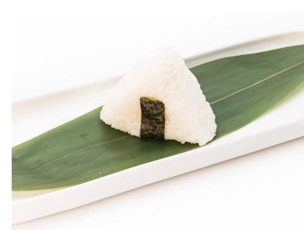
085 ONIGIRI ANGUILLA 1PZ (anguila, mayo e teriyaki) € 3,00