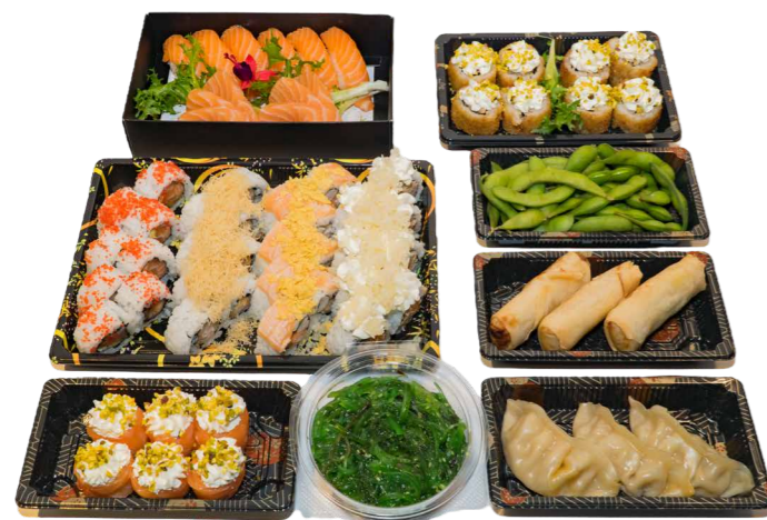
BOX 64 PZ 32 Uramaki, 8 uramaki fritti, 6 nigiri, 6 gunkan, 6 sashimi + 4 antipasti € 50.00