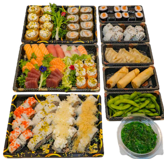
BOX 98 PZ 40 Uramaki, 16 uramaki fritti, 8 nigiri, 6 gunkan, 16 sashimi + 4 antipasti € 80.00