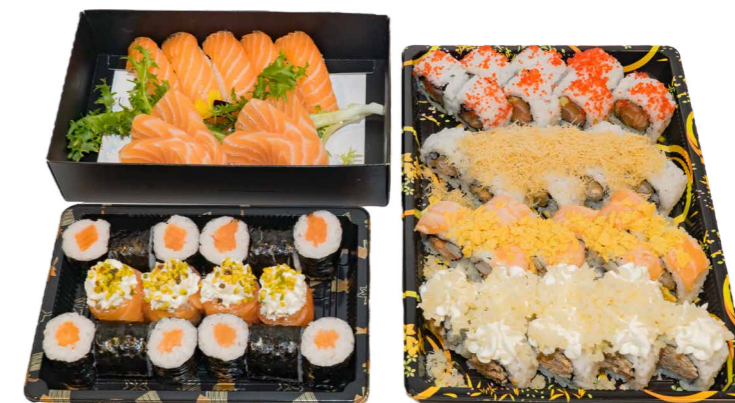
BOX 58 PZ 32 Uramaki, 5 nigiri, 6 sashimi, 4 gunkan, 12 hosomaki € 35.00