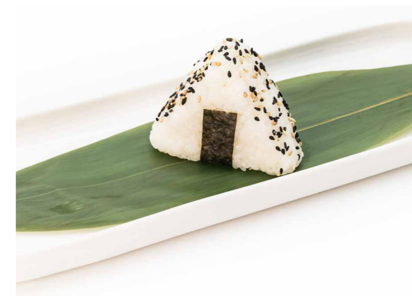
083 ONIGIRI MAGURO 1PZ (tonno cotto, mayo, sesamo, teriyaki) € 3,00