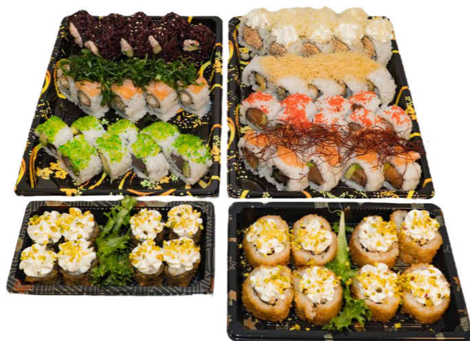
BOX 72 PZ 48 Uramaki, 8 uramaki fritti, 8 uramaki black, 8 hosomaki fritti € 55.00