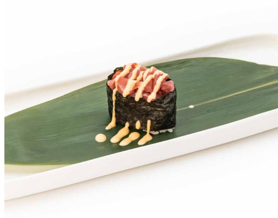
073 NORI TUNA SPICY 1PZ (bocconcini di riso avvolti con alghe, guarniti con tartare di tonno piccante) € 2,00