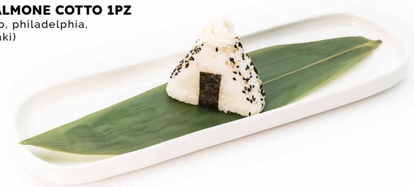
081 ONIGIRI SALMONE COTTO 1PZ (salmone cotto, philadelphia, sesamo, teriyaki) € 3.00